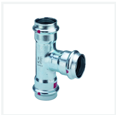
Prestabo-T-komad sa SC-Contur Model 1118 Artikl 558 628