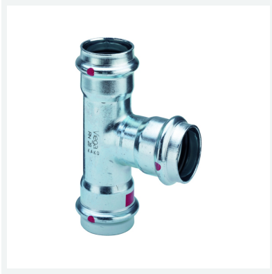
Prestabo-T-komad sa SC-Contur Model 1118 Artikl 642 693