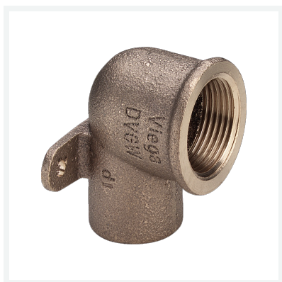
Zidna pločica Model 94472G Artikl 113 490