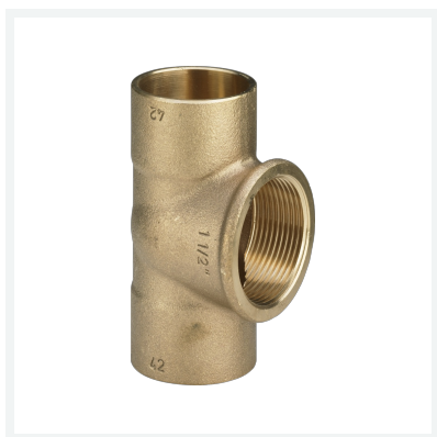
T-komad Model 94130G Artikl 102 401