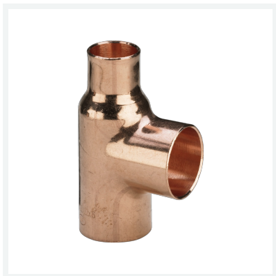
T-komad Model 95130 Artikl 103 217